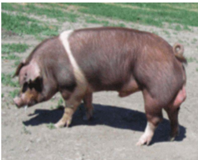
Рисунок 8 – Хряк породы гемпшир (в НСО не используется; пример зарубежной селекции)