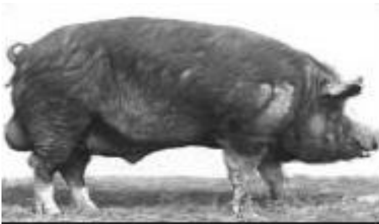
Рисунок 7 – Хряк кемеровской породы