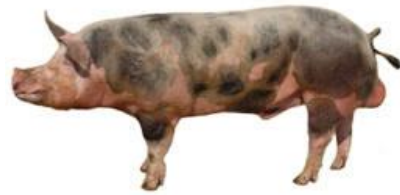
Рисунок 2 – Хряк породы пьетрен (в НСО не используется; порода мировой рекордсмен по мясной продуктивности)