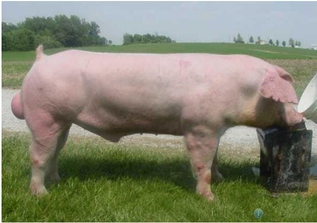
Рисунок 6 – Хряк скороспелой мясной породы (СМ-1)